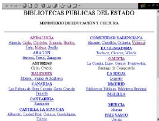
Fig. 1. BPE (servidor del MCU)

Las Bibliotecas Públicas del Estado, según el RD. 582/1989, de 19 de mayo de 1989, aquellas adscritas al Ministerio de Cultura a través de la Dirección General del Libro y Bibliotecas, se caracterizan por tener una información mínima centralizada a través de la página web del Ministerio de Cultura < http://www.mcu.es/bpe/bpe.html >, desde donde se puede acceder al catálogo bibliográfico, bien por