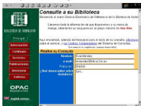
Fig 2. Biblioteca pública de Granada

Otra de las características que encontramos en los webs de estas bibliotecas es la tentativa de interacción con el usuario a través de Internet, por ejemplo, la biblioteca pública de Granada ha incluido recientemente un nuevo servicio denominado "la biblioteca responde" donde cualquier lector de esa biblioteca o de cualquier parte de España y/o del mundo, puede consultar al bibliotecario sobre Andalucía; o la biblioteca pública de Tarragona que